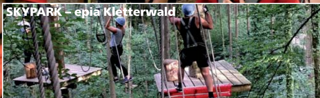
SKYPARK – epia Kletterwald