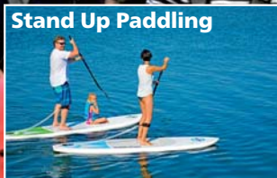
Stand Up Paddling